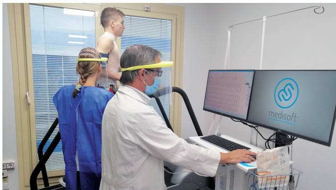
Paciente realizando pruebas médicas.