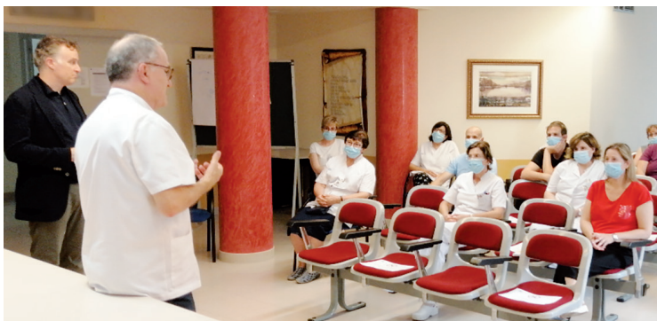
Acto de reconocimiento a los/as profesionales de la Clínica, tras la primera ola.