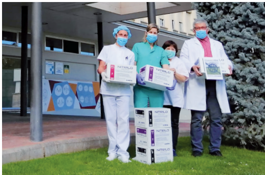
Donación de material sanitario realizada por el Club Ciclista Sindicat del Pedal.