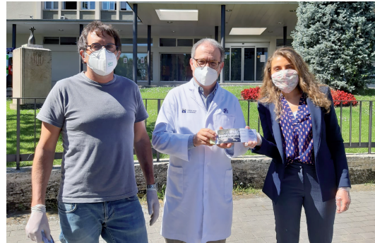
Los restaurantes Vora Estany y La Carpa regalaron menús en agradecimiento a los sanitarios/as.