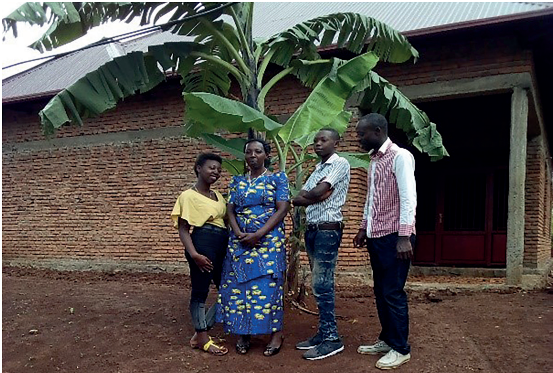
Una de las viviendas construidas para familias en situación de vulnerabilidad.