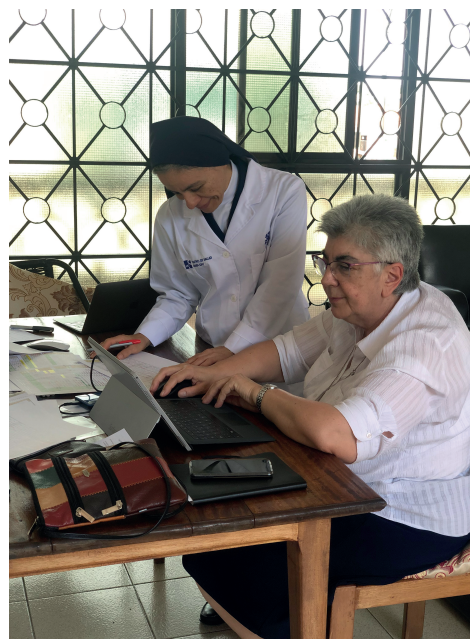
La Delegada Gral. de Misiones (izda.) y la de Centros (dcha.) en la Comunidad de Bata (Guinea Ecuatorial).

Otro año más, en nombre del equipo de Misiones, gracias por vuestra solidaridad y compromiso.