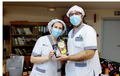
Obsequio para los premiados en el sorteo de Navidad de la Clínica.