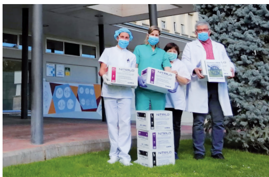
Donació de material sanitari realitzada pel Club Ciclista Sindicat del Pedal.