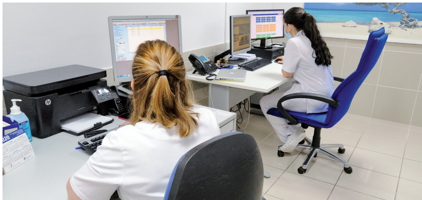
Un dels nous espais de treball de l'Àrea d'Urgències.

La nova Àrea compta ara amb un accés exclusiu, tres boxs d'atenció individual, dues sales d'espera i una nova sala d'observació, ampliant així notablement el servei per a la població de la comarca.