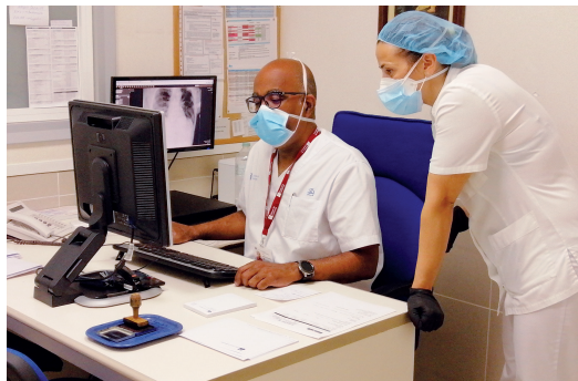
Analitzant les radiografies d'un pacient de covid-19.