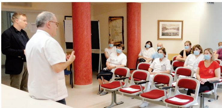
Acte de reconeixement als/a les professionals de la Clínica, després de la primera onada.