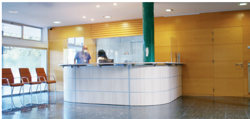
Nou hall i àrea de recepció.

Tot i la situació viscuda, el pla de remodelació de la planta principal de la Clínica va poder dur-se a terme amb èxit. Un dels espais renovats va ser el de l'entrada principal, juntament amb el hall i l'àrea de recepció, per optimitzar l'ús de l'espai, la lluminositat i l'accessibilitat de les persones que acudeixen al Centre.