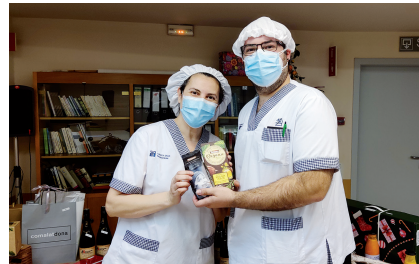
Obsequi per als premiats en el sorteig de Nadal de la Clínica.