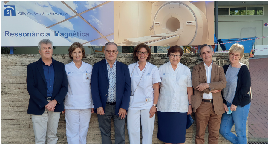
Equip directiu i superiora de la comunitat del Centre.

Em plau presentar la memòria d'activitat 2020. Aquest ha estat un període singular per a tothom, en què la Clínica s'ha hagut d'adaptar organitzativament i funcional a la pandèmia de la covid-19 i, alhora, continuar oferint una assistència de qualitat.