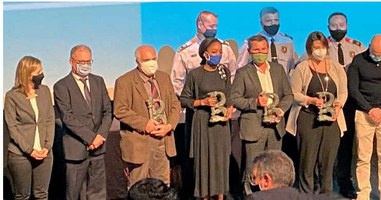
Premis Banyolí de l'Any . La Clínica, juntament amb altres estaments de Banyoles, va rebre el premi a "La gestió de la crisi sanitària per la covid.19: Millor Iniciativa Social Especial".

Durant aquest 2020 el Centre ha esdevingut un protagonista de primer nivell, reconegut al mes de setembre amb un dels premis Banyolí de l'Any .