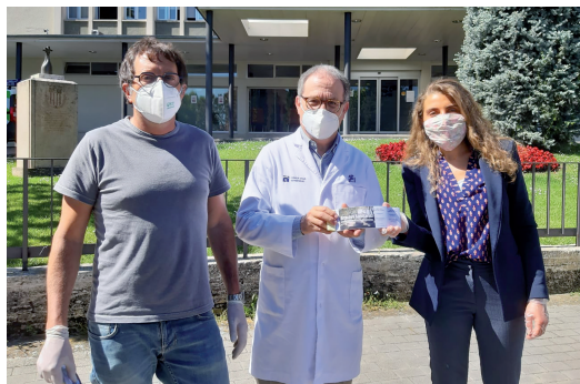
Els restaurants Vora Estany i La Carpa van regalar menús en agraïment als sanitaris/àries.