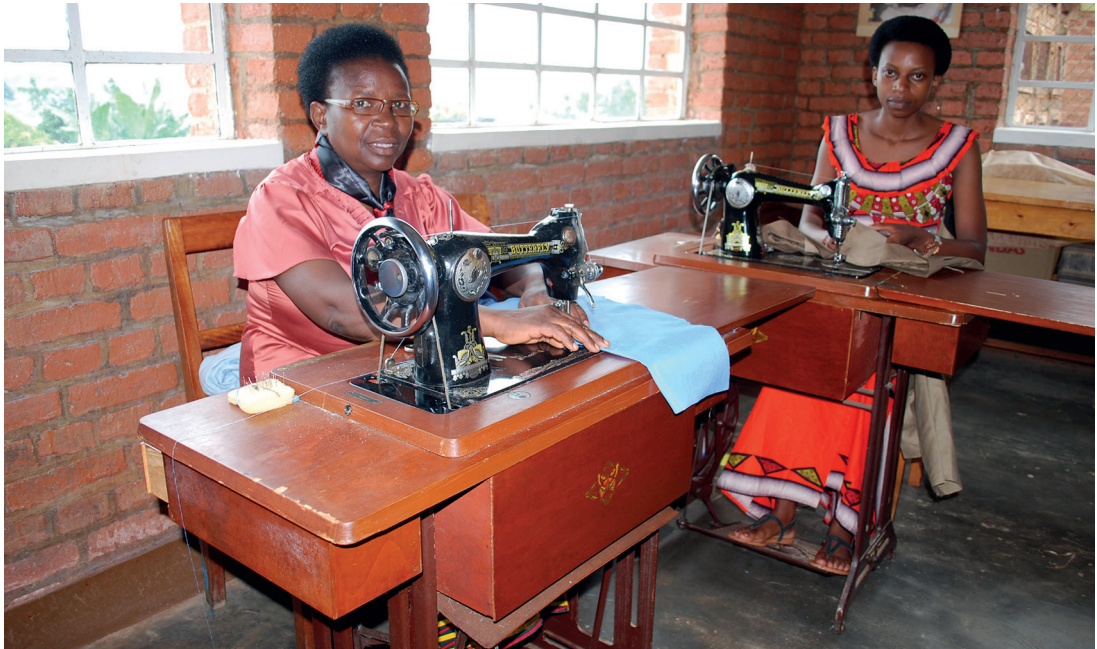
Taller de costura de Nyarusange (Ruanda).