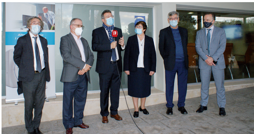
Un moment del parlament de l'Ill·lm. Sr. Miquel Noguer, alcalde de Banyoles, en la inauguració de la Unitat de Ressonància Magnètica.

El 25 de novembre, la Clínica i Instituts Guirado van inaugurar la Unitat de Ressonància Magnètica, ampliant la capacitat de resposta en el camp del radiodiagnòstic amb una alta qualitat tecnològica i mèdica, apropant aquest servei als professionals i pacients del Pla de l'Estany.