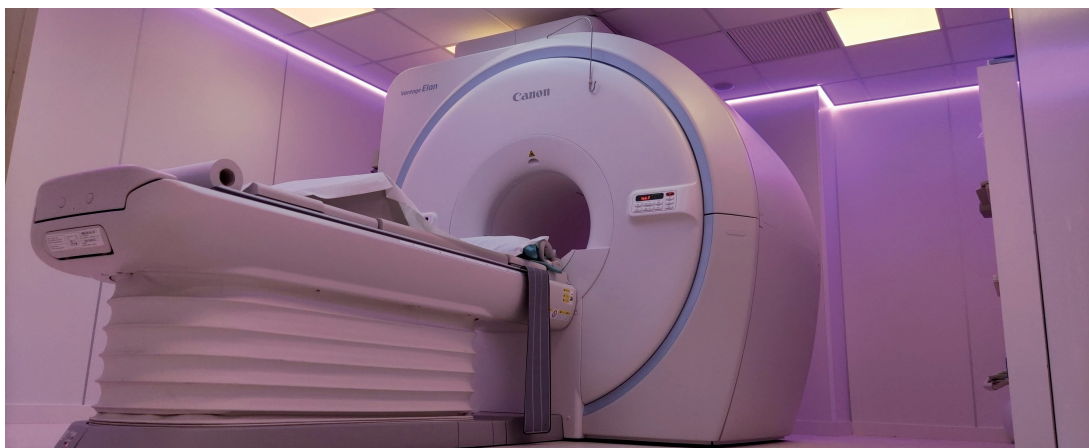
Nou equip de ressonància magnètica.