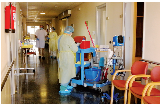
El servei de neteja i desinfecció ha tingut un paper extremadament important durant la pandèmia.