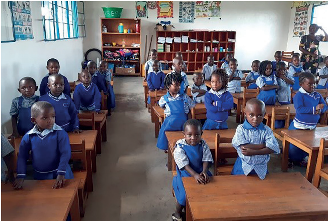
Alumnat del Centre d'Éducation Rubare (R. D. del Congo).