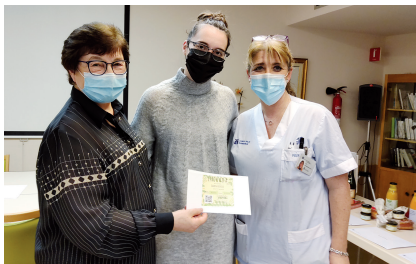
Regal d'una participació de la loteria de Nadal.

L'equip de cuina va voler ajudar a alleugerir la càrrega dels professionals sanitaris posant en marxa el "Menjar per emportar-se". Així, els professionals podien endur-se a casa menjars preparats en acabar el seu torn laboral.