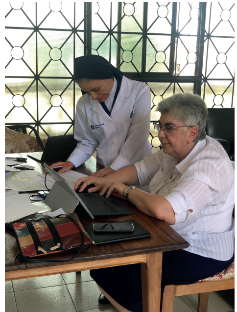
La Delegada Gral. de Missions (esq.) i la de Centres (dreta) a la Comunitat de Bata (Guinea Equatorial).

Un altre any més, en nom de l'equip de Missions, gràcies per la vostra solidaritat i compromís.