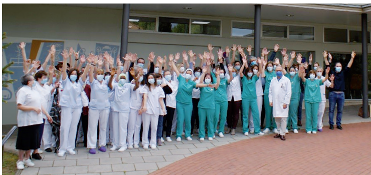
Salutació de l'equip de la Clínica Salus Infirmorum.

Durant tot l'any s'han rebut nombroses i significatives mostres de suport per part dels habitants de Banyoles i de la comarca. Particulars, familiars de pacients, entitats, empreses i institucions, han volgut participar en aquest reconeixement al nostre Centre i sobretot als/a les nostres professionals fent donacions de bens, tant per afrontar amb majors garanties d'èxit la lluita contra aquesta pandèmia, com per reconèixer l'excel·lent feina realitzada en moments tant difícils.