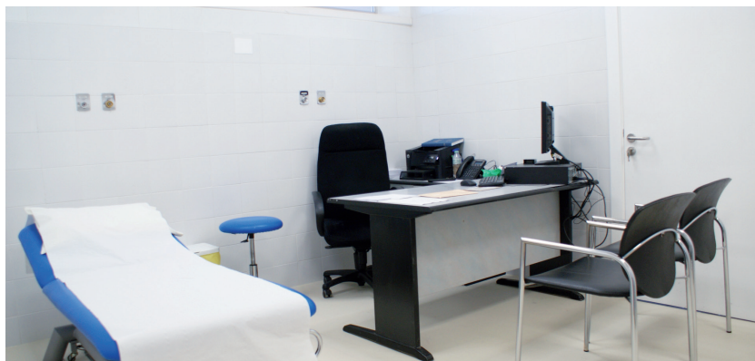
Una de les quatre noves consultes de traumatologia, situades a la planta baixa.

A l'octubre van entrar en funcionament quatre noves consultes de traumatologia. Ubicades a la planta baixa, a prop de l'accés principal a la Clínica, substitueixen i modernitzen les anteriors i ofereixen a pacients i especialistes espais nous, més funcionals i còmodes.